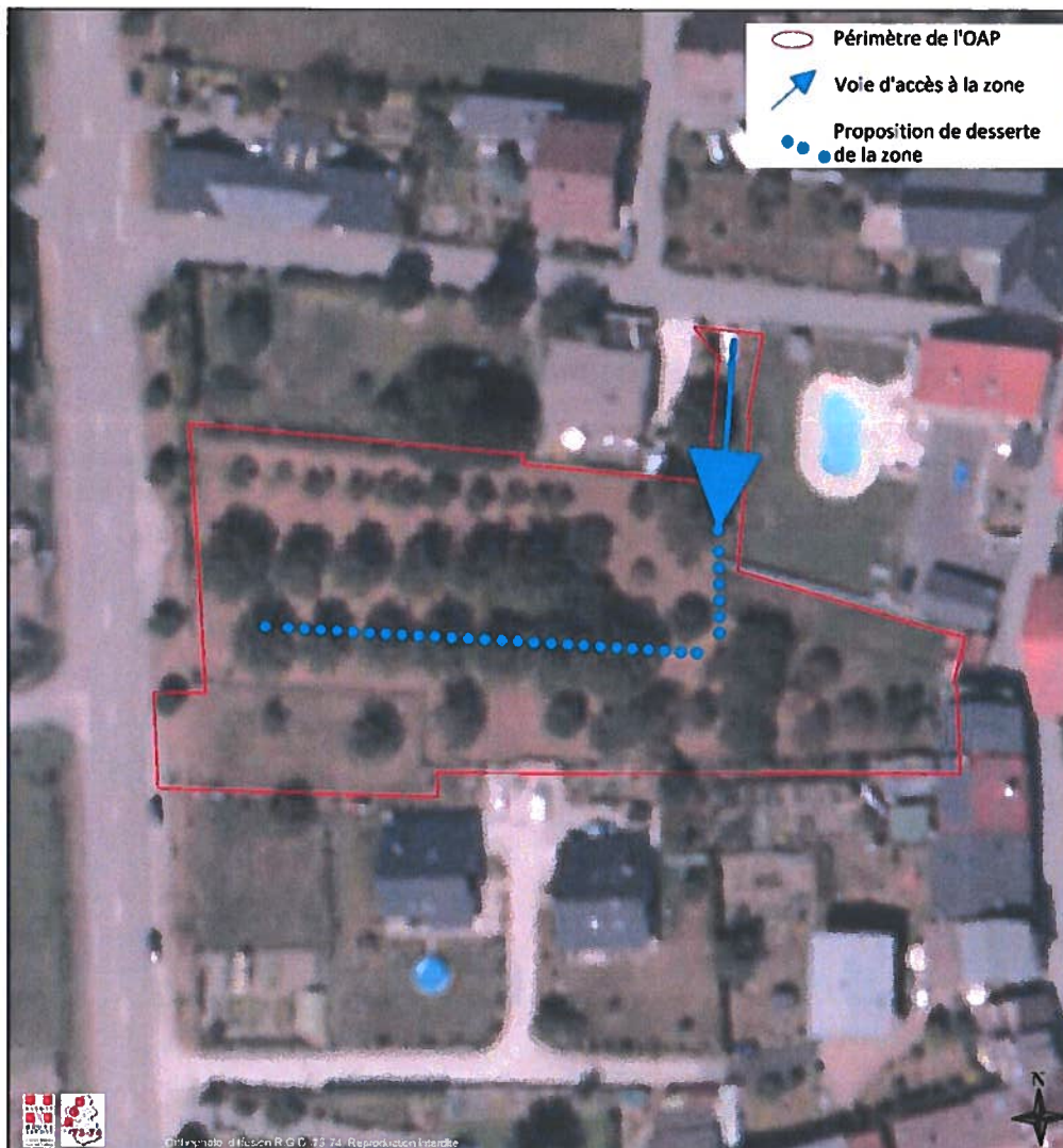
Figure 2 : Orientation d'aménagement et de programmation des Granges