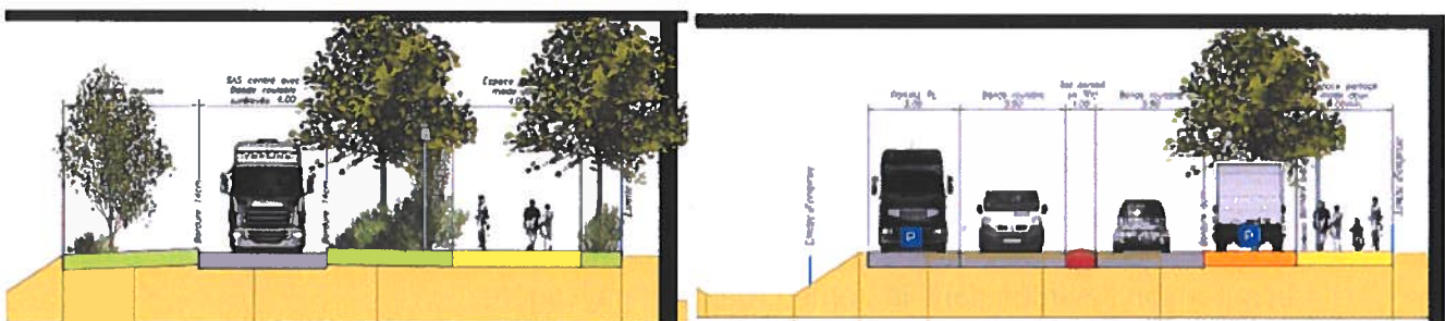
Figure 3 : Exemples d'aménagements proposés pour la RD990