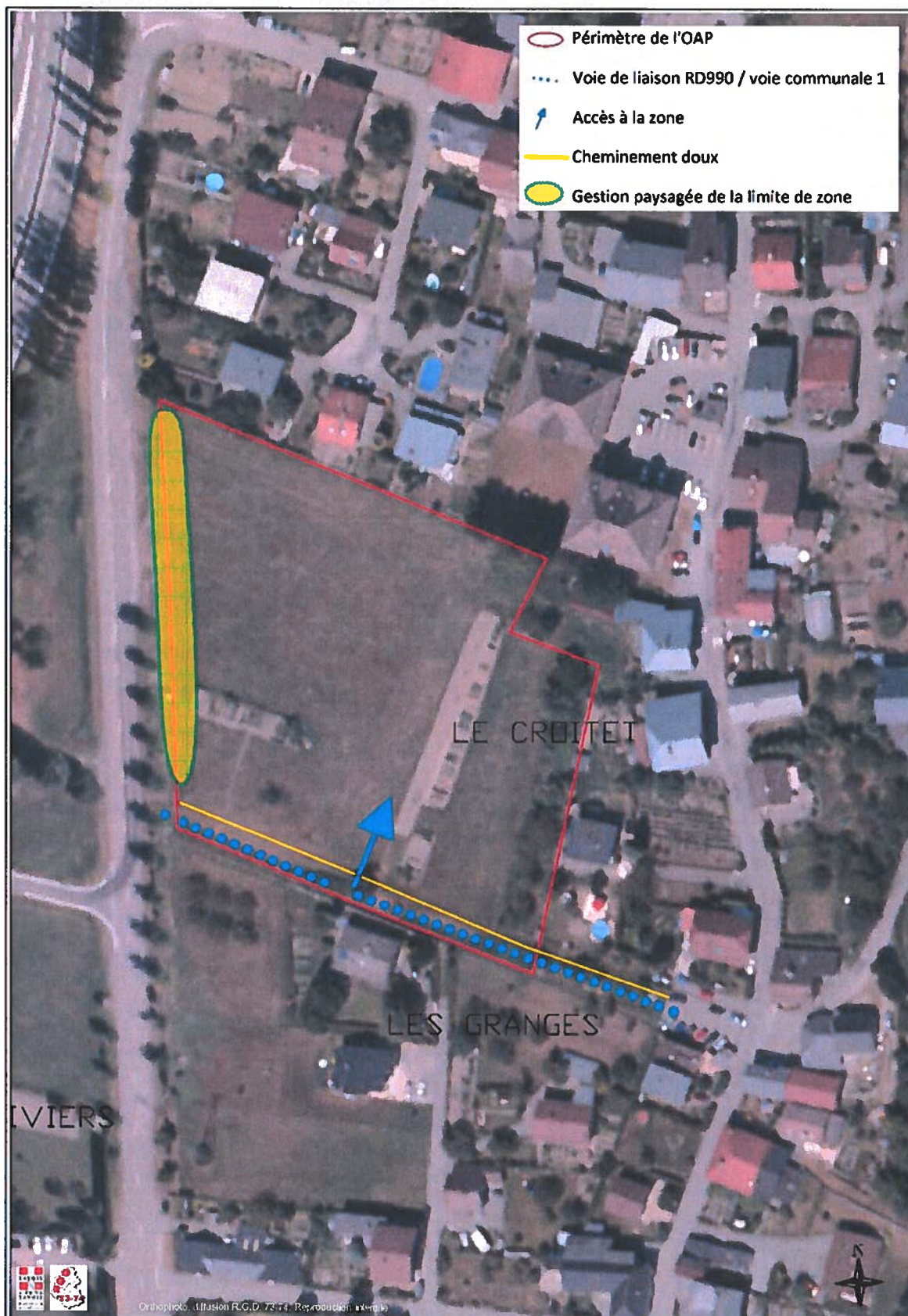
Figure 1 : Orientation d'aménagement et de programmation du Croitet